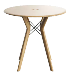
table de réunion, hauteur totale de 110cm