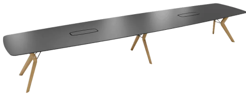
table de conférence, hauteur totale de 76cm