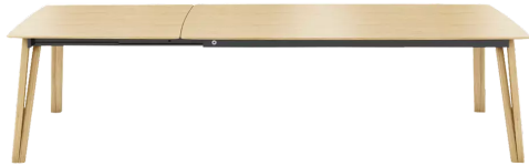
table de salle à manger, hauteur totale de 76cm