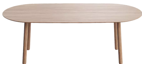
table de salle à manger, hauteur totale de 76cm